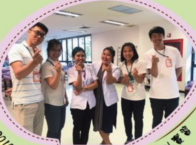
2018年本系學生赴泰國馬希賓大學海外實習